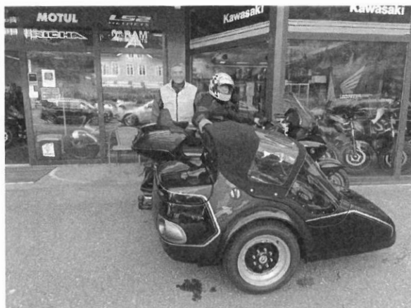
Bjørn og Hein klar for første tur!

Sidevognen har god plass og er rimelig grei å komme inn og ut av og vi har også en tilhenger som gjør at man kan ta med rullestol om nødvendig. Motorsykkelen har tilpasset bremse(bakbremse) og "automatgir" slik at all betjening kan gjøres med hendene.